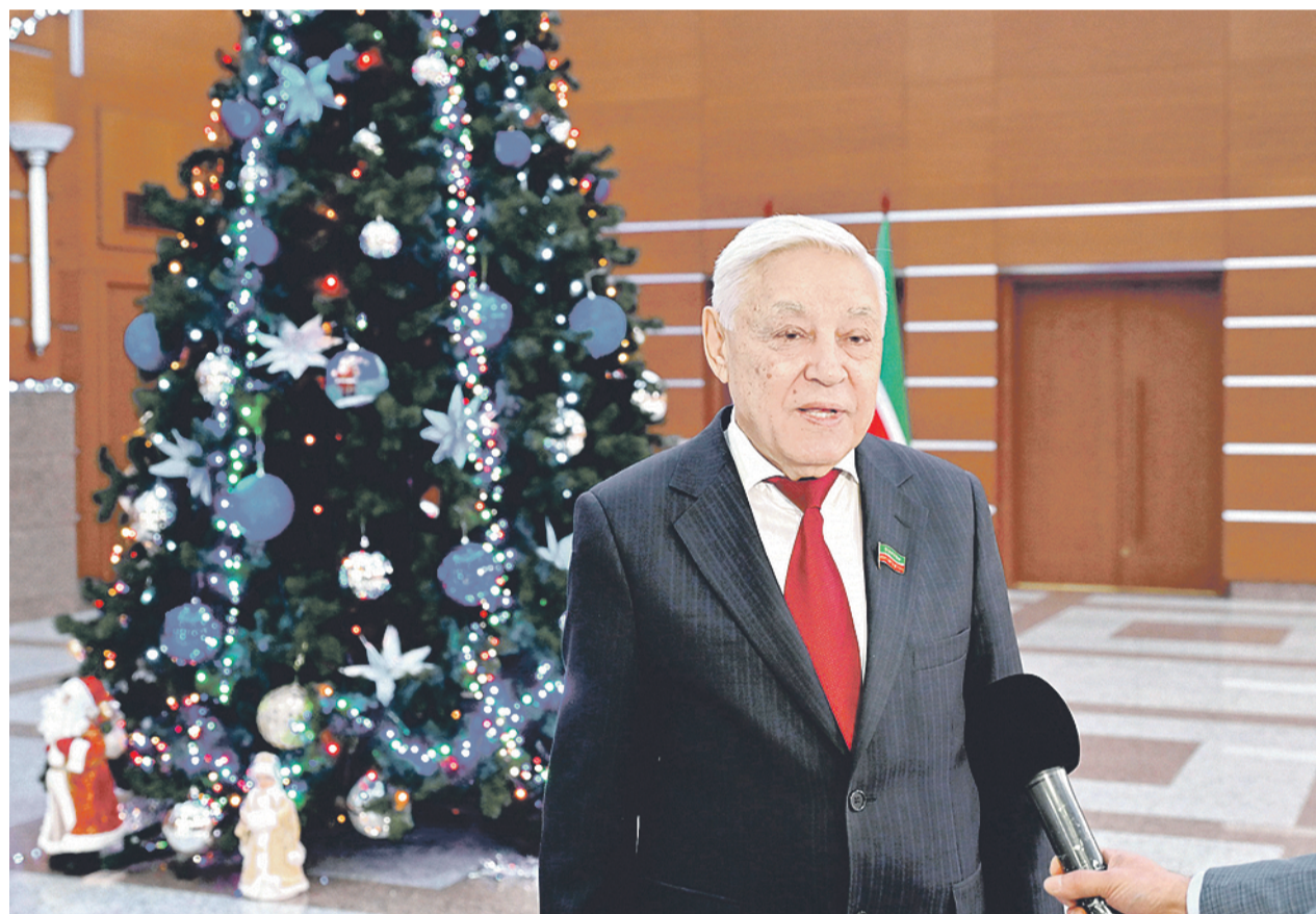
Пресс-служба Госсовета РТ