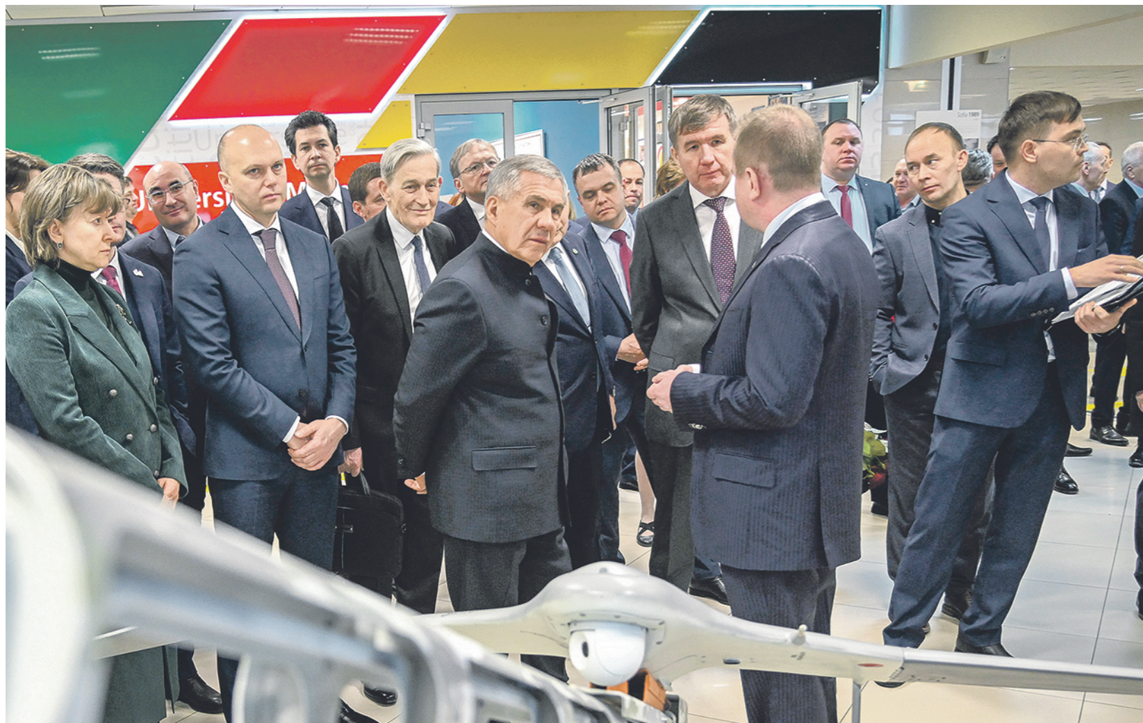
Пресс-служба Раиса РТ

Экономика Татарстана побеждает трудности