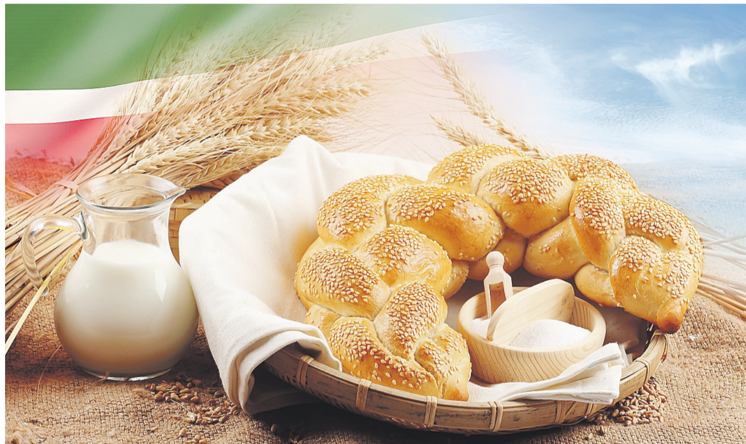
Коллаж Олега ПЕПЛОВА

День работника сельского хозяйства и промышленности отмечается в России во второе воскресенье октября, но в Татарстане его празднуют с небольшим опозданием – после окончания всероссийской выставки «Золотая осень», в которой наша республика традиционно принимает активное участие.