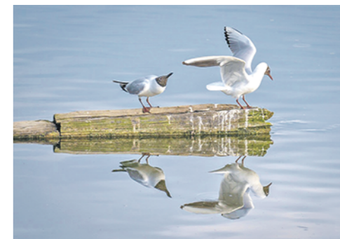
Дикие птицы чаще всего становятся разносчиками опасных инфекций.