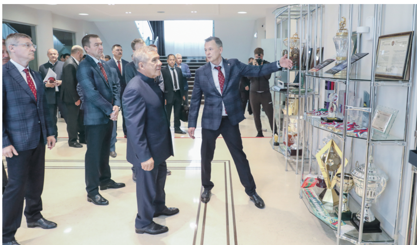
В преддверии нового футбольного сезона Рустам Минниханов напутствовал игроков казанского «Рубина» на новые победы в премьер-лиге.