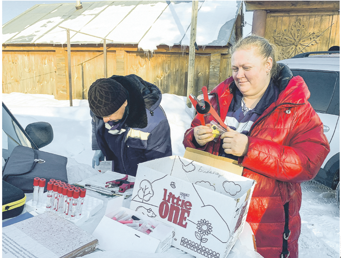
Ветврачи проводят бесплатную идентификацию животных в личных подсобных хозяйствах.

Корове – бирку, собаке – чип, пчеле – штрихкод. Четвёртый год в стране идёт массовая идентификация домашней живности.