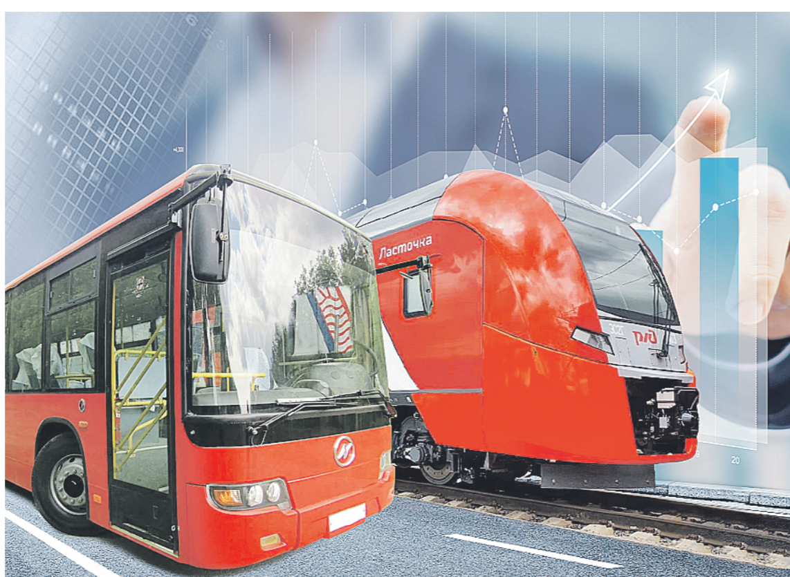
Контакт Директ РЕПОБЛА