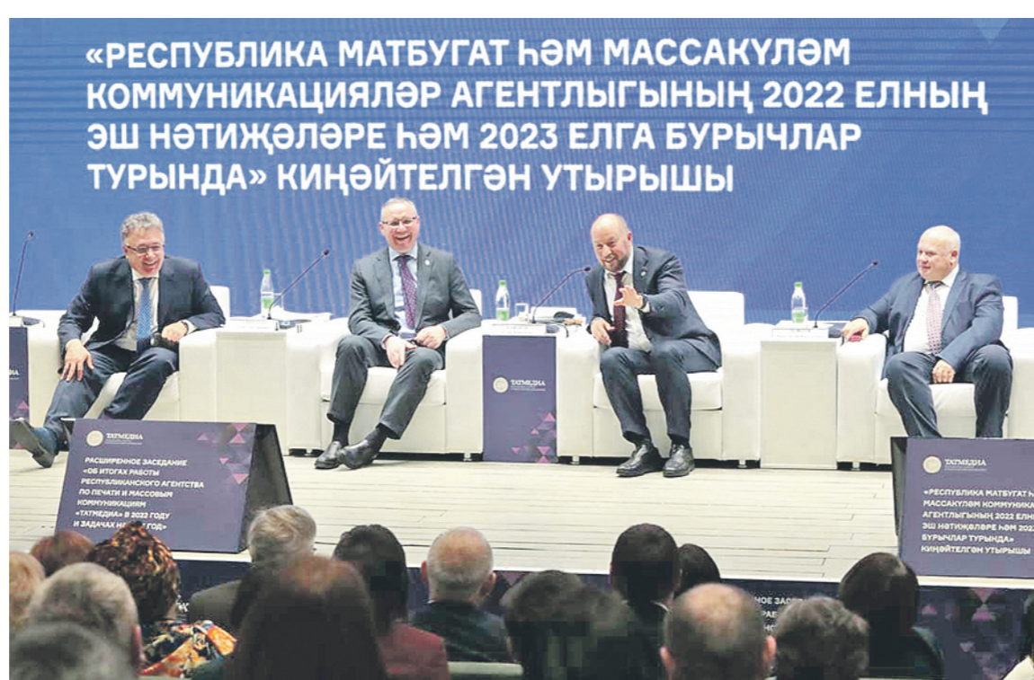
«РЕСПУБЛИКА МАТБУГАТ ҺӘМ МАССАКУЛӘМ КОММУНИКАЦИЯЛӘР АГЕНТЛЫГЫНЫҢ 2022 ЕЛНЫҢ ЭШ НӘТИҖӘЛӘРЕ ҺӘМ 2023 ЕЛГА БУРЫЧЛАР ТУРЫНДА» КИҖӘЙТЭЛГӘН УТЫРЫШЫ

Средствам массовой информации, действующим в республике, следует с особым вниманием относиться к подаче информации о специальной военной операции на Украине.