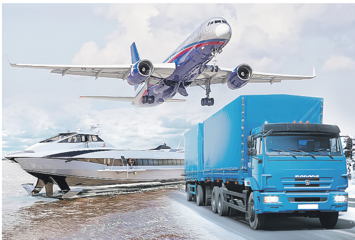
Коллекция: Омега ПЕПЕЛОВА

В концепции аэропорта от 2009 года был заложен показатель пассажиропотока в 2,5 миллиона человек. Его должны были достичь только к этому времени. А уже сейчас имеем четыре миллиона», – сказал Фарит Ханифов.