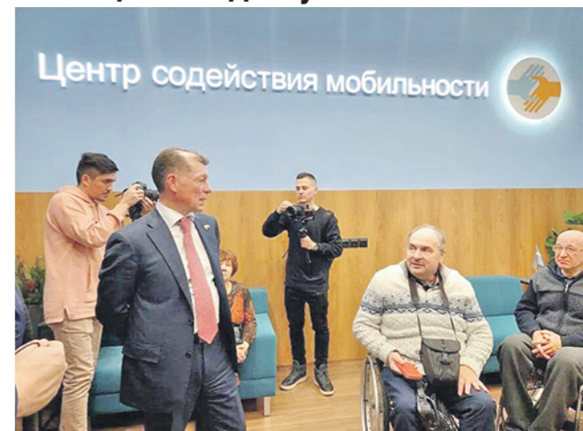
Центр содействия мобильности

ЗОНА ОЖИДАНИЯ ДЛЯ МАЛОМОБИЛЬНЫХ ПассажиРОВ ПОЯВИЛАСЬ НА ЦЕНТРАЛЬНОМ ЖЕЛЕЗНОДОРОЖНОМ ВОКЗАЛЕ В КАЗАНИ (Ильшат САДЫКОВ).