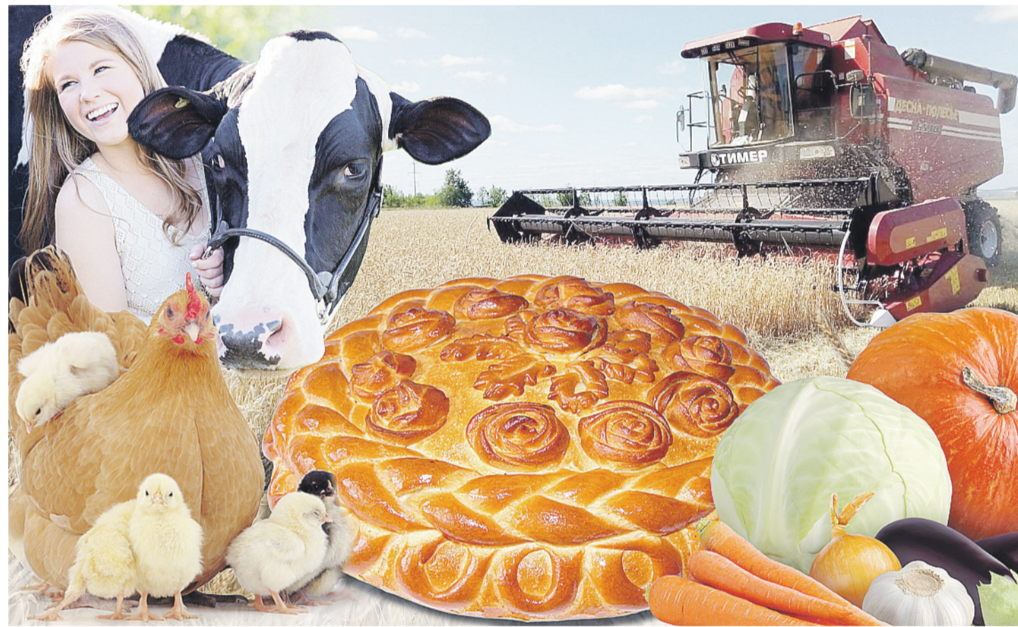
Коллаж: Ольга ПЕПЛОВА

С какими бы вызовами ни сталкивался Татарстан за свою многолетнюю историю, работа сельскохозяйственной отрасли не останавливалась ни на один день. Сегодня продукция сельского хозяйства – это стратегический ресурс, а агропромышленный комплекс – один из локомотивов развития республики.