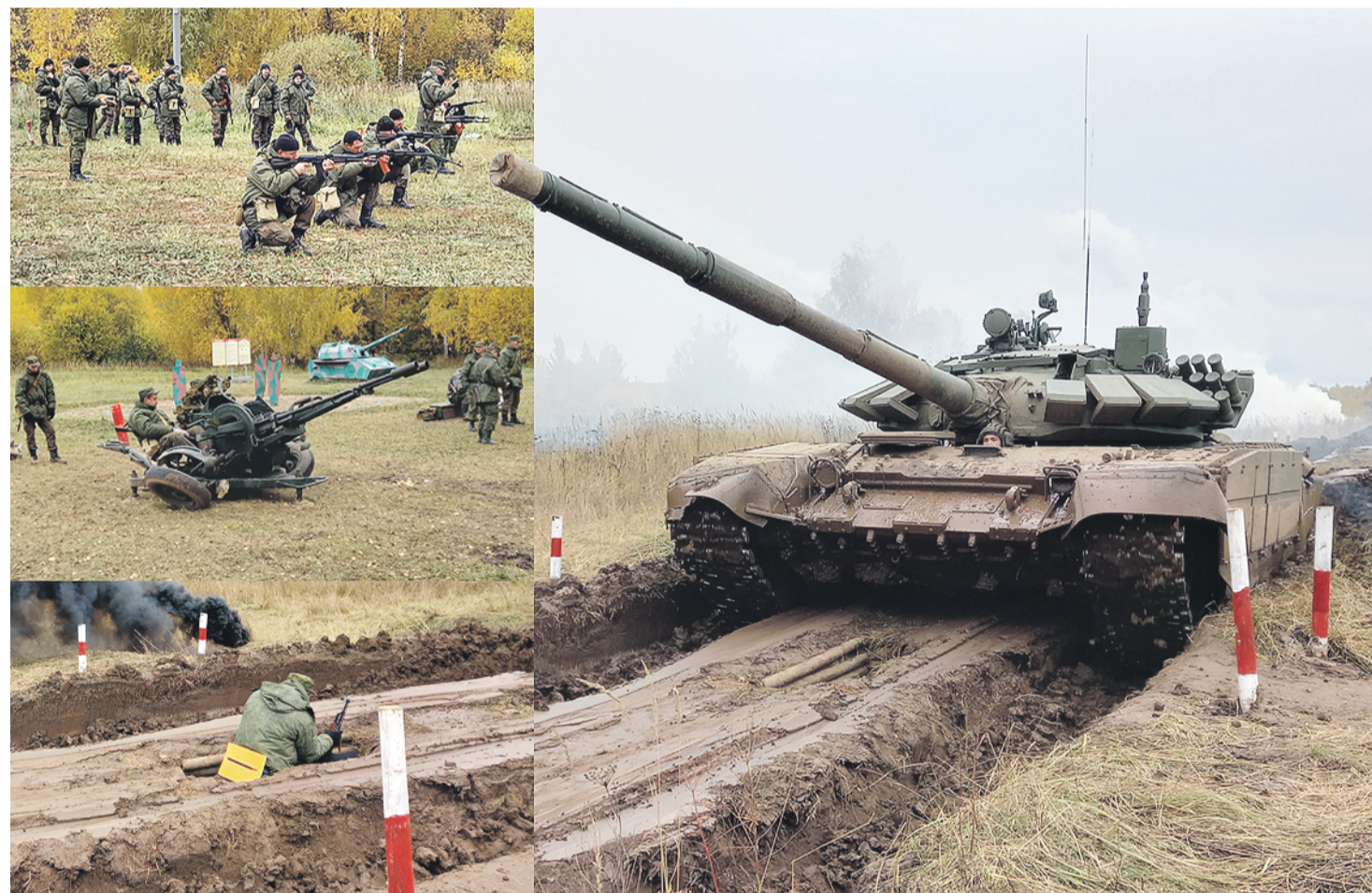
Коллаж: Олега ПЕПЛОВА