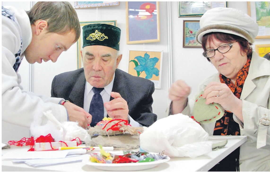
В Декаду пожилых люди тысячи пенсионеров получили возможность бесплатно заниматься делом, к которому лежит душа.

Со времён Древнего Рима и до Средних веков средняя продолжительность жизни людей не превышала 25 лет.