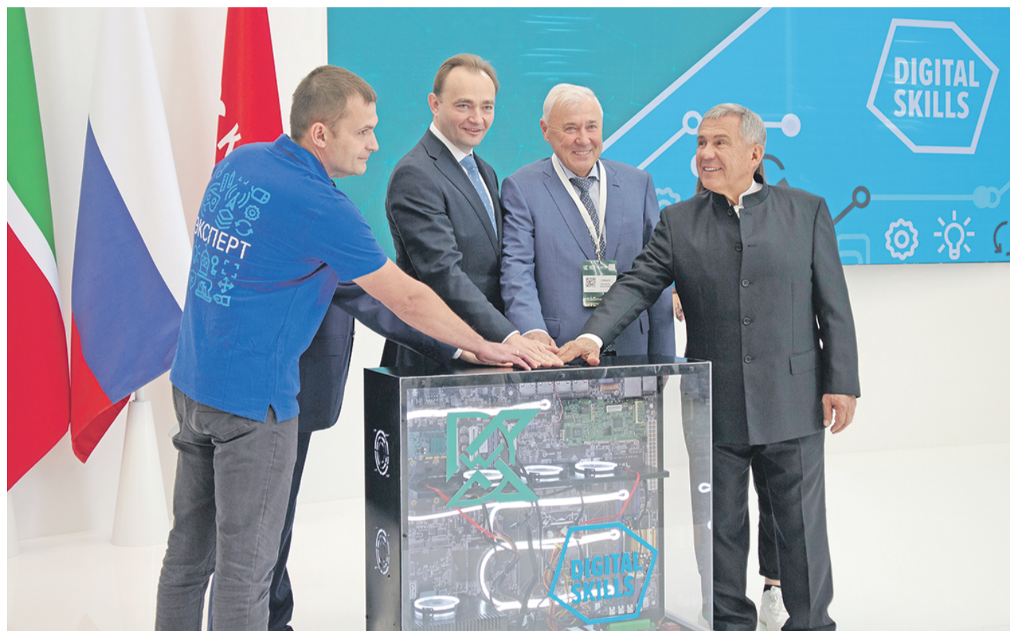
Почётные гости дают старт форуму Kazan Digital Week.