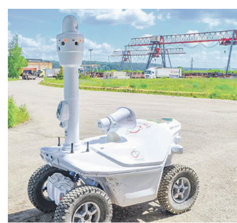
Механическому чоповцу хватает одной зарядки аккумуляторов, чтобы трижды проехать по всему периметру предприятия.

ПАТРУЛИРОВАТЬ ТЕРРИТОРИЮ БУГУЛЬМИНСКОГО МЕХАНИЧЕСКОГО ЗАВОДА (БМЗ) НАЧАЛ РОБОТ-ОХРАННИК «ТРАЛ ПАТРУЛЬ», СООБЩАЕТ ИЗДАНИЕ «НЕФТЯНЫЕ ВЕСТИ» (Алексей СЕРГЕЕВ). Работа разработана в компании SMP Robotics (Зеленоград). Если он успешно пройдёт испытания, то аналогичная техника может появиться и на других предприятиях «Татнефти», подразделением которой является БМЗ. Заводчане позитивно отнеслись к появлению необычного стража и дали ему имя Фёдор. Механическому чоповцу хватает одной зарядки аккумуляторов, чтобы трижды проехать по всему периметру предприятия. Маршруты движения задаются автоматически и меняются несколько раз в сутки. Вычислить, когда и где появится Фёдор, нельзя: разработчики учли многие нюансы охранной деятельности и оснастили машину камерами кругового обзора. При обнаружении зловещего робота следует за ним на некотором расстоянии. А если нарушитель начинает преследовать устройство, то оно, сохраняя безопасную дистанцию, отступает. Всё происходящее передаётся на пульт дежурного.