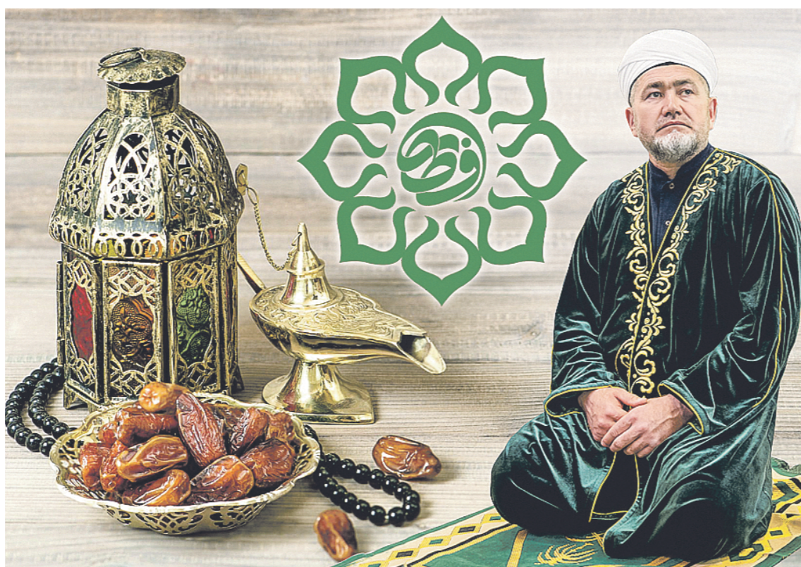
Камал Директ ИФТАР

Александр МЕДВЕДЕВ, «РТ» Стала историей 80-я легкоатлетическая эстафета на призы газеты «Республика Татарстан»