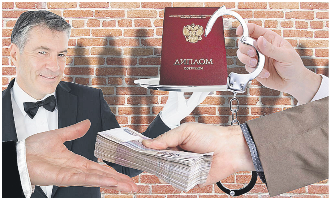
Коллаж: Ольга ПЕТУХОВА

По итогам первого квартала текущего года осуществлено четырнадцать проверок. В тринадцати случаях установлены факты неполного и недостоверного предоставления сведений о доходах. Уже привлечено к административной ответственности шесть человек, в оставшихся случаях проверки либо не завершены, либо их итоги пока не подведены. На это законодательством отводится 30 дней. Так что избежать ответственности никому не удастся.