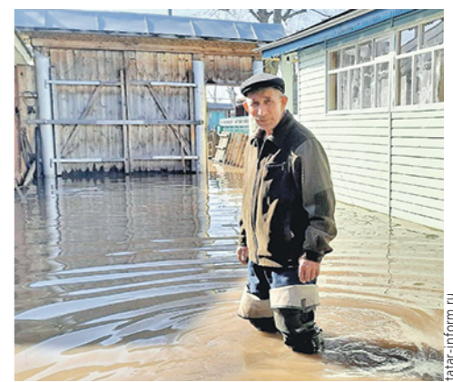
На прошлой неделе вышедшая из берегов река Кубня подтопила зеленодольское село Татарское Танаево.