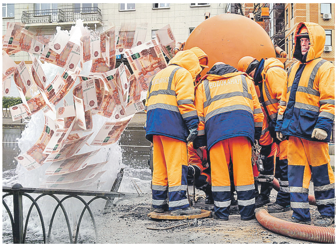
Некоторые объекты невозможно оформить даже по закону.

Нынешним летом в нашем казанском дворе неподалёку от новой детской площадки образовалось два провала. В асфальте на пешеходной дорожке появились «дыры», потому что грунт размыл водой из обветшавшего водопровода. Хорошо, что никто не пострадал. Конечно, трубу со временем залатали, а провалы заасфальтировали. Тем не менее это показательный пример серьёзной проблемы, решать которую необходимо как можно скорее.