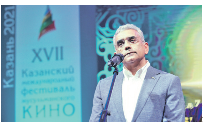
Председатель жюри фестиваля Эльчин Мусаюгулу

XVII Казанский международный фестиваль мусульманского кино открылся по традиции красной, или звёздной, дорожкой, по которой в минувшее воскресенье гости, участники и члены жюри кинофорума.