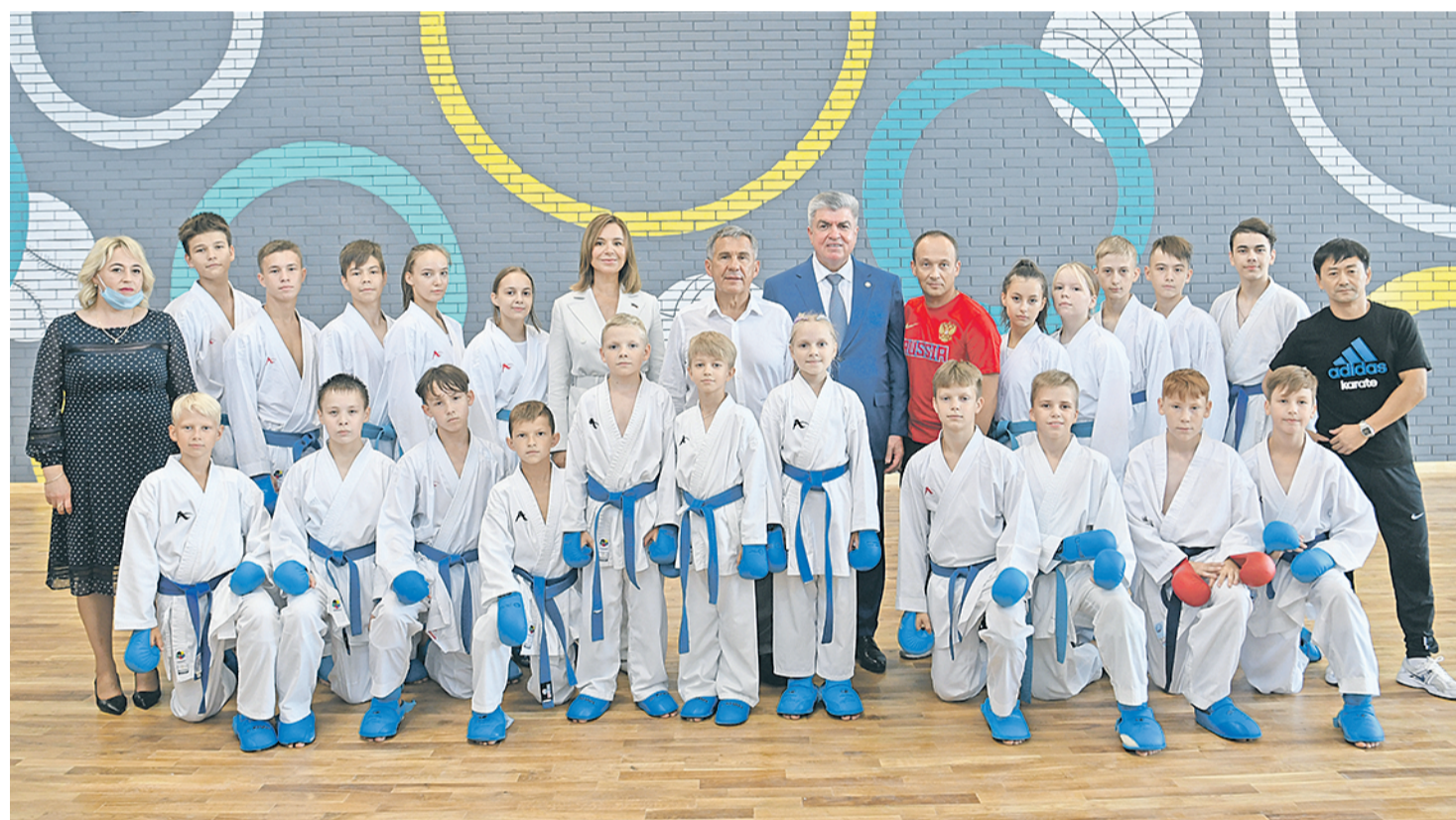
В новой школе в Замелекесье – хорошая спортивная база. Юные спортсмены не упустили возможности сфотографироваться с Президентом.

Президент Рустам Минниханов посетил с рабочей поездкой Набережные Челны. В рамках визита он принял участие в открытии новой школы в микрорайоне Замелекесье. Об этом информирует пресс-служба главы республики.