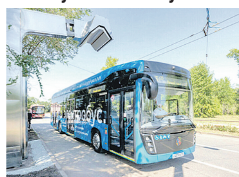
Машина заряжается около двадцати минут, этого объёма ей с запасом хватает для того, чтобы полностью пройти маршрут.