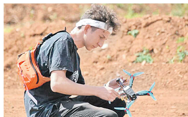
пресс-служба Минцифры РТ

«Кванториум» организовал конкурс беспилотников