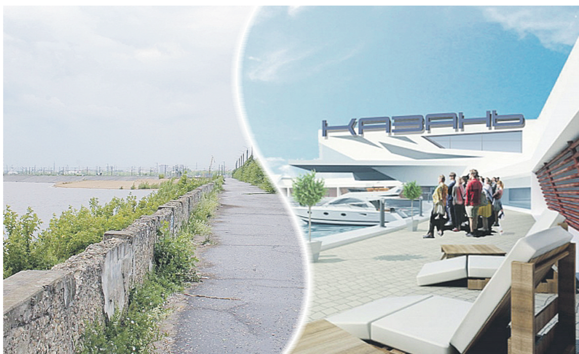
Консультант: Олеся ПЕТУХОВА

Три огромные промышленно-жилищные территории в Казани – «Локомотив», «Портовая» и «Родина» – планируется кардинально реконструировать. В частности, построить здесь современные жилые микрорайоны с развитой инфраструктурой и площадками для отдыха. На первых двух участках, которые находятся рядом с Волгой, планируется обустроить ещё и набережные, открыв доступ к реке горожанам и гостям столицы. Такие масштабные планы содержит принятый в прошлом году федеральный закон о комплексном развитии территорий (КРТ). Если опыт Казани окажется успешным, то масштабную реконструкцию планируется провести и в других муниципальных образованиях республики.