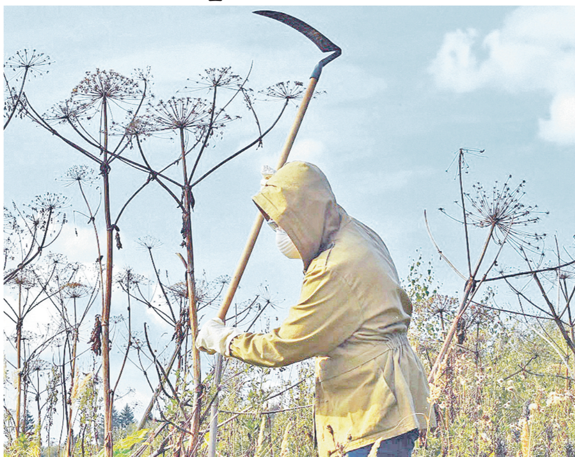
Борщевик не должен быть хозяином на полях и в селениях.