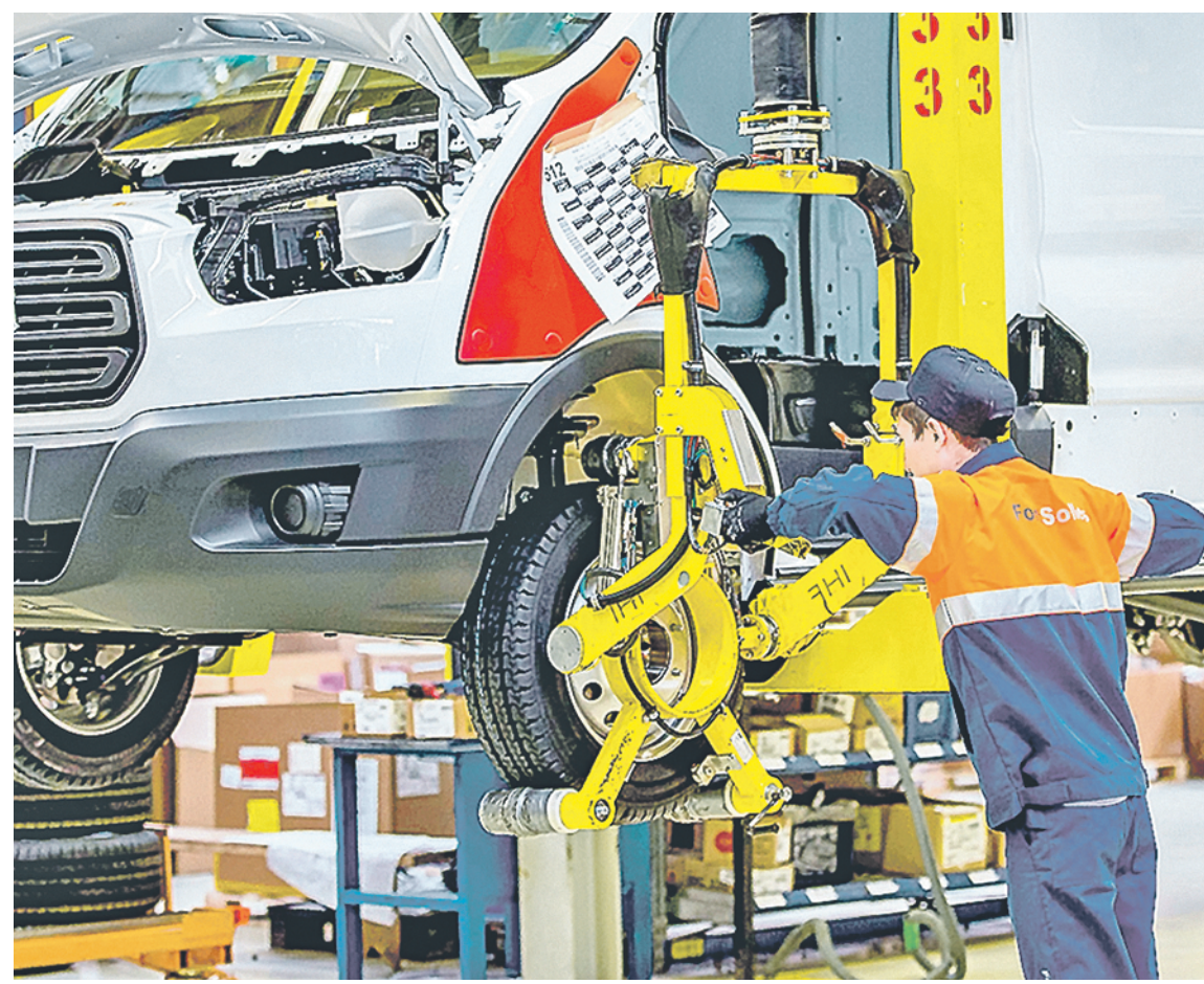
Развитие экономики требует финансовых вложений. Сборка автомобилей в ОЭЗ «Алабуга».

«Наша задача – сделать так, чтобы успешные цифровые стартапы как можно чаще появлялись в России, –