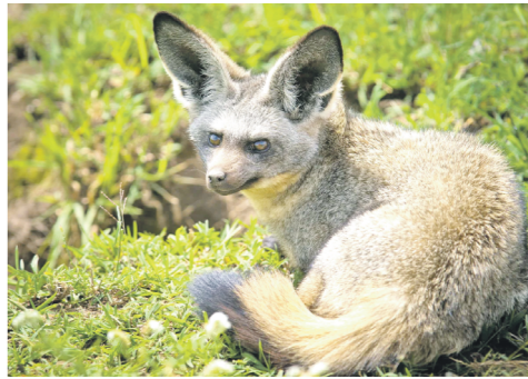
В зоопарке «Река Замбези» живут две большеухие лисицы.

САМКА ЕНОТА БЕЛЛА ПОМОГЛА ВЫБРАТЬ ИМЕНА ДЛЯ БОЛЬШЕУХИХ ЛИСИЦ, ОБИТАЮЩИХ В КАЗАНСКОМ ЗООПАРКЕ «РЕКА ЗАМБЕЗИ» (Ильшат САДЫКОВ). Как сообщили в пресс-службе мэрии столицы, лисицы родились в Южно-Африканской Республике, после чего переехали в Чекию. С августа прошлого года они поселились в Казанском зоопарке. По традиции, имена им выбирали жители столицы. Условиями конкурса оговаривалось, что в именах должны присутствовать африканские мотивы. В финал вышли три имени, а четвёртое предложили сами сотрудники «Реки Замбези». Доверить окончательный выбор было предложено самке енота Белле. На листочки с именами были выложены кусочки банана, и Белла сделала свой выбор, съев сначала два из них. Большеухие лисицы названы именами Эмба, что означает «вера», и Фарей, что переводится как «радость».