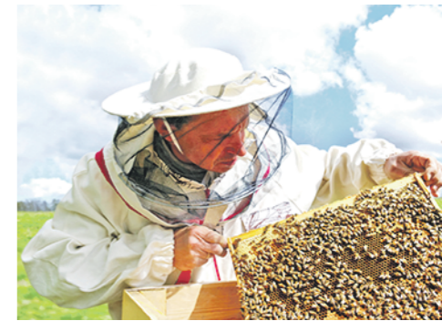
Оповещение пчеловодов позволит им своевременно принять меры для недопущения отравления насекомых пестицидами.