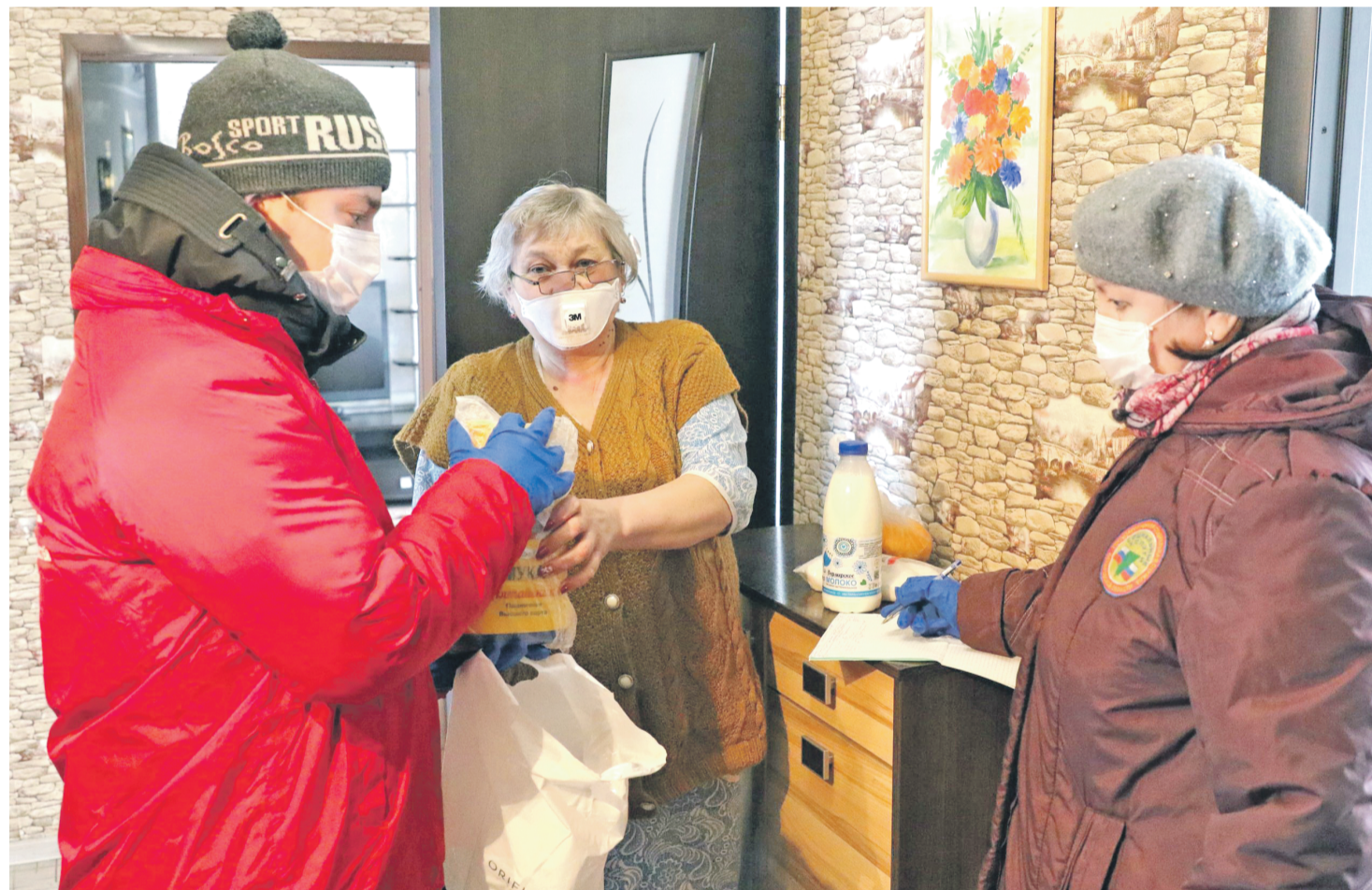
Пресс-служба татарстанского отделения ОНФ