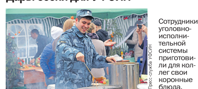
Сотрудники уголовно-исполнительной системы приготовили для коллег свои коронные блюда.

В УЧЕБНОМ ЦЕНТРЕ УФСИН ПО ТАТАРСТАНУ СОСТОЯЛАСЬ ЕЖЕГОДНАЯ ЯРМАРКА-КОНКУРС С ГОВОРЯЩИМ НАЗВАНИЕМ «ДАРЫ ОСЕНИ» (Антон ШАБАРДИН, «РТ»). Ещё Пётр I считал, что для нелёгкой службы в тюремном ведомстве нужны люди «твердые, добрые и весёлые». Так что нет никакого противоречия в том, что стражи закона, члены их семей и ветераны приняли участие в искромётном осеннем празднике. Каждая из команд от учреждений, прибывших на ярмарку, подготовила номера художественной самодеятельности, сказочное оформленные торговые площадки и, конечно, продукцию с приусадебных участков. Кроме того, сотрудники уголовно-исполнительной системы сделали для коллег свои коронные блюда, включая шашлык и выпечку, домашние консервы, а также выставки на прилавки предметы кухонной утвари, цветочные композиции и натюрморты, которые, как и продукты, можно было приобрести по самым демократичным ценам. Победители в кулинарно-художественных и спортивных номинациях праздника получили грамоты и призы от руководства ведомства.