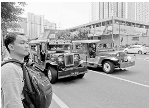
На улицах Манилы.

Оседлав каждый приглянувшуюся лошадку, я и мои друзья тронулись в путь к жерлу таинственного вулкана Тааль. По конной тропе прошли более двух километров, поднявшись на значительную высоту. Лошадка мне попала некрупная, но сильная и выносливая, одним словом, горная. И всё было бы хорошо, если бы не пыль. Мелкая и противная, белая, порой красная. Она долго стояла столбом после прохода многочисленных всадников, двигавшихся туда и обратно. У многих на лицах были противопыльные повязки. А вот мы в порыве восторга от увиденного в на-