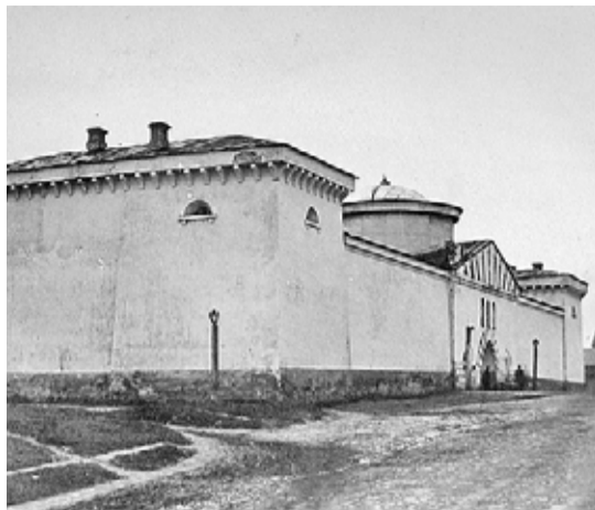
Казанский губернский тюремный замок, XIX век.