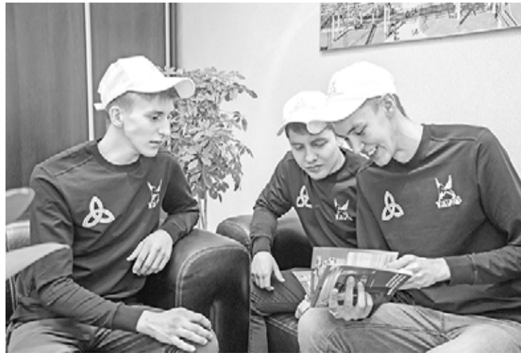
Один из важных этапов подготовки к WorldSkills – научить ребят работать в команде.

На оснащение колледжа специальным оборудованием и покупку расходных материалов было затрачено более 26 млн рублей. Сейчас КНН им. Н.В.Лемаева является специализированным центром компетенций по подготовке молодых специалистов к WorldSkills и проведению отборочных чемпионатов. Здесь тренируют специалистов высокого класса по двум направлениям – «Лабораторный химический анализ» и «Изготовление изделий из полимерных материалов».