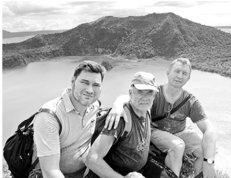
На фоне вулкана Тааль.