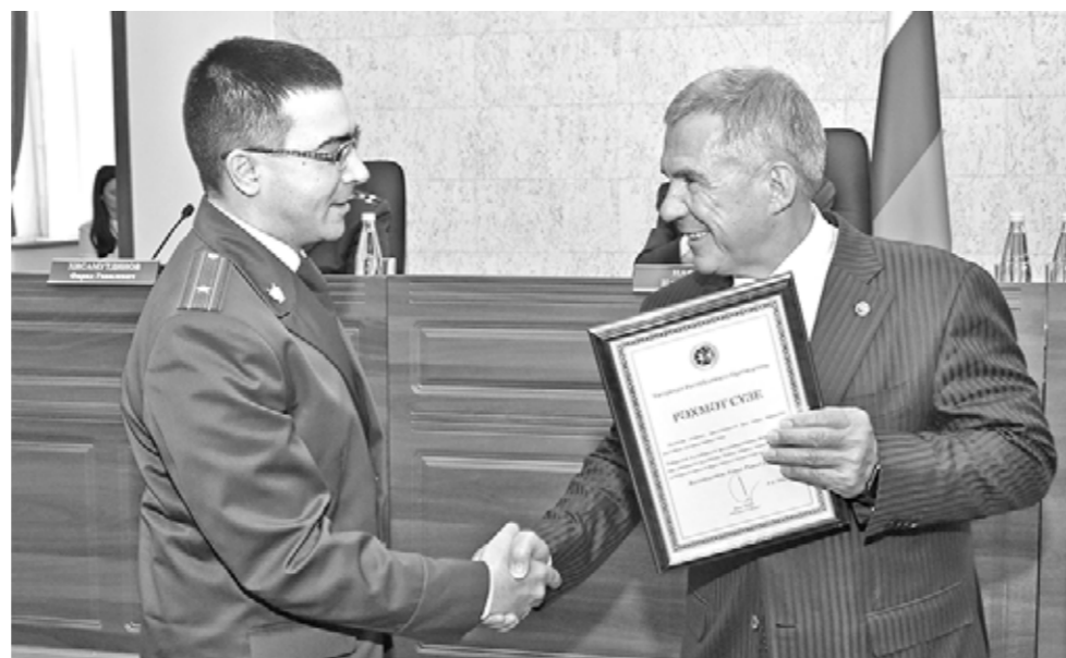
Начало на стр.1

со своими работниками, прокурор РТ назвал АО «Татфлот», ГК «ПСО», КЗСК, «Ак барс холдинг». В сфере противодействия коррупции, по словам Илдуса Нафикова, выявлено 2800 нарушений. Посетовав на то, что в отношении коррупционеров слабо используется такой действенный инструмент, как увольнение в связи с утратой доверия, прокурор РТ потребовал от прокуроров на местах «прекратить кабинетный метод работы, встряхнуть и своих подчинённых, и поднадзорные органы».