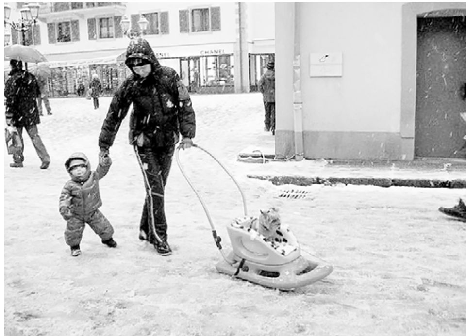
Кто в семье главный?

Взяли в отделение с испытательным сроком молоденькую медсестричку. Утро. Забор крови поручили новенькой. Подходит она ко мне через несколько минут: глазки светятся – задание выполнила. Ну что, умничка, быстро. Захожу в процедурку – вот они, пробирочки с кровью, красиво стоят в штативе, все братья-близнецы безымянные. Ну забыла наклеить фамилии, ну и чего орать.