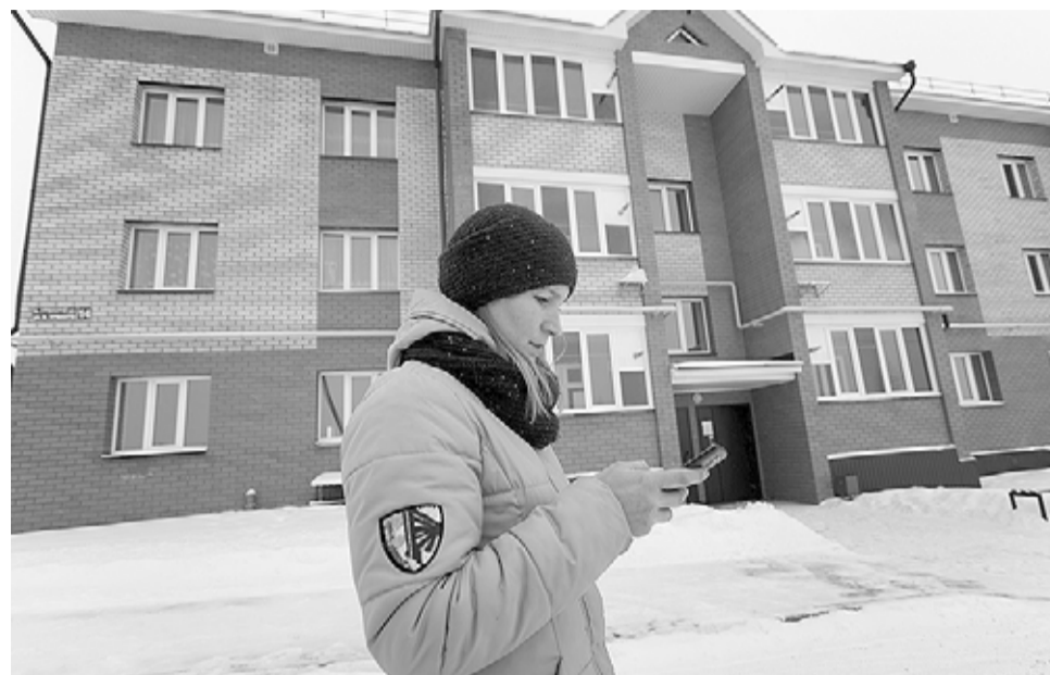
Жители пилотного дома с помощью мобильного приложения в своём телефоне могут узнать информацию от «умных» систем.

По его словам, Татарстан подтверждает статус цифрового лидера среди регионов России. Республика активно способствует внедрению цифровых проектов в сферах управления жилищно-коммунальным хозяйством, государственным и муниципальным управлением, в корпоративном секторе. Сегодня в регионе, к примеру, в Казани, Елабуге и Альметьевске, тестируется ряд IT-технологий, связанных с Интернетом вещей. Это