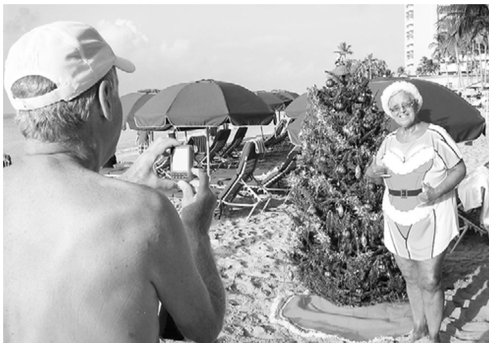
Не всем везёт с новогодней погодой...

– Боже мой, какой же ты всё-таки у меня idiot. На какие деньги мы будем жить весь следующий месяц?!