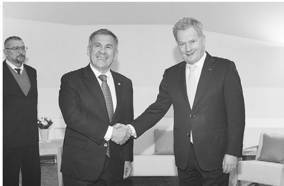
Во время встречи с Президентом Финляндии.

Финские татары служат примером того, как, успешно адаптируясь в другой стране, можно на протяжении долгих десятилетий бережно хранить свои национальные традиции и язык. Об этом Рустам Минниханов говорил на встрече с татарской общиной Финляндии. Во встрече принял уча-