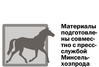
Материалы подготовлены совместно с пресс-службой Минсельхозпрод РТ