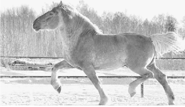
1. Общественная служба «РТ»

Лошади данного типа относятся к группе местных, аборигенных пород. Они отличаются высокой выносливостью, неприхотливостью, хорошей приспособленностью к природным условиям и устойчивостью к вирусосенным насекомым и наиболее распространенным болезням. Их разведение имеет большой успех при табунном коневодстве в фермерских хозяйствах. Работа по возрождению татарской породы лошадей ведется в тесном сотрудничестве с коллегами из Москвы.