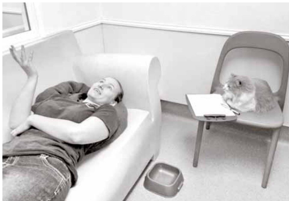
Кошка – лучший психолог.

Вчера с утра невольно был проведён эксперимент, достойный публикации в лучших научных журналах. Голодный нечесанный кот оказался на равном расстоянии между мной – расчесывателем, и женой – кормилицей. Ему предстояло решить, к кому пойти. Кот разрывался на части, думал буквально полминуты и выбрал меня с щёткой-чесалкой, справедливо решив, что еда никуда не денется, а вот мимо массажа щёткой можно и пролететь.