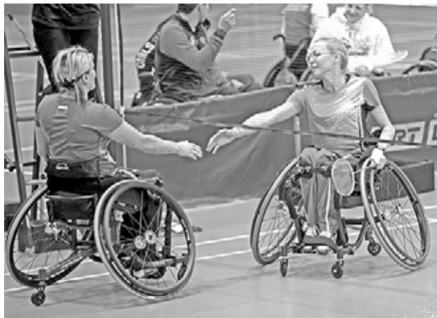
el emalomat / ИТ ГОЛОС ВО

В Казани завершился финальный этап Кубка России по бадминтону среди спортсменов с поражением опорно-двигательного аппарата, 69 участников которого разыграли награды в шести разрядах.