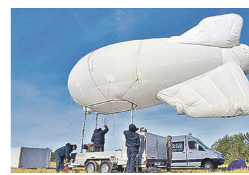
Комплекс «ОКО-60» предназначен для высотного наблюдения при помощи специальной аппаратуры, установленной на аэростате.

Как сообщила пресс-служба силового ведомства, дорожные полицейские и специалисты авиационного отряда Росгвардии провели операцию с использованием комплекса высотного наблюдения «ОКО-60». С высоты двухсот метров видеосистема аэростата просматривала обстановку на трехкилометровом участке одной из трасс республики, на которой часто происходят ДТП с пострадавшими. Информация обо всех нарушениях в режиме реального времени поступала к автотранспортникам. Уже за первый час работы аппарат зафиксировал три обгона при действии запрещающего знака. Со временем аппарат все чаще будет применяться для выявления нарушителей.