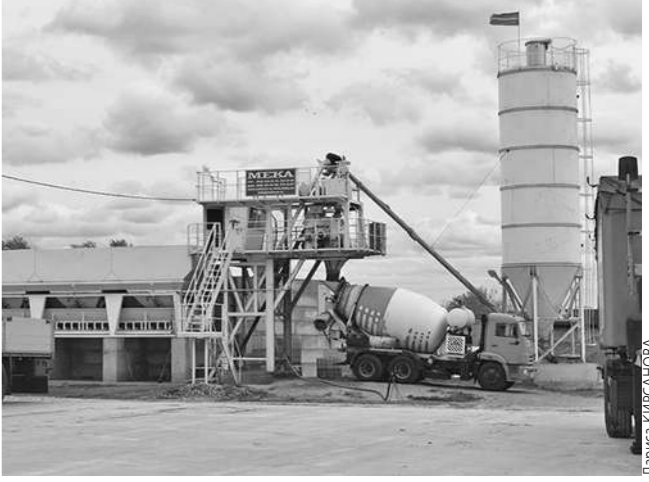
Один из объектов площадки – бетонный завод турецкого производства «Мека-30».

В Татарстане промышленные парки муниципального уровня, на создание инфраструктуры которых направляются в том числе и бюджетные средства, имеются в каждом районе. А в некоторых – и по несколько. Частных промплощадок, созданных исключительно на деньги инвесторов, пока не так много. Но они есть и неплохо развиваются.