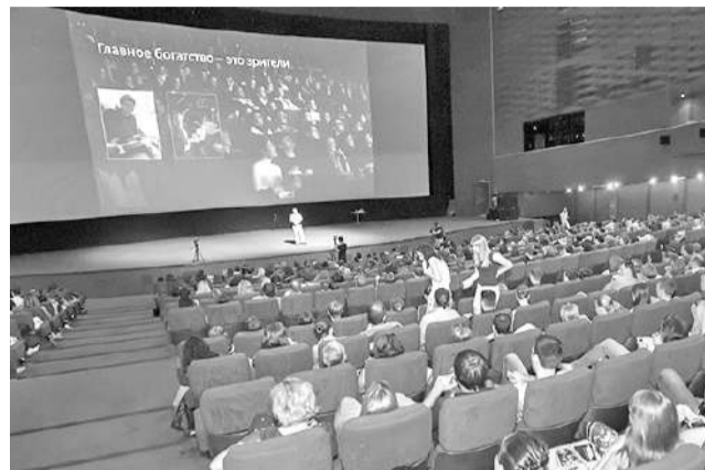
До конца года в Татарстане планируется открыть четыре кинозала.

В период с 2015 по 2017 год из российского Фонда кино было выделено РТ 113 млн рублей на оснащение современным оборудованием 23 кинозалов. 1 сентября начали работу 18 модернизированных кинозалов. В результате сбор от продажи билетов составил 25,8 млн рублей, количество сеансов превысило 23 тысячи, обслужено более 160 тысяч зрителей. Для сравнения: в 2016 году сбор состав-