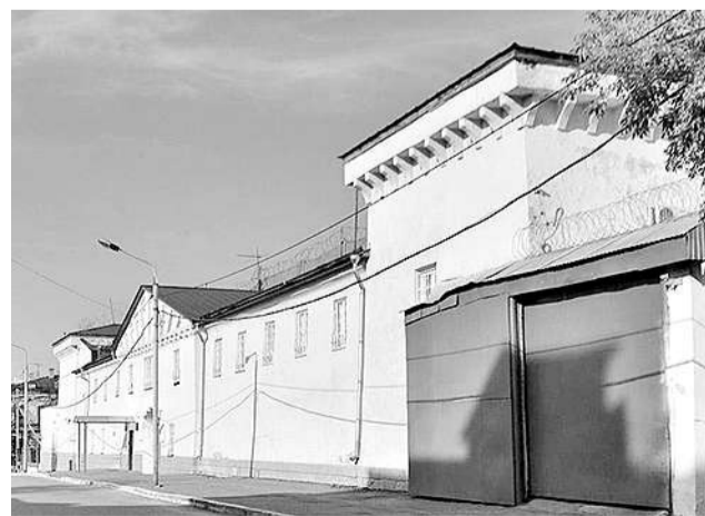
СИЗО №1 на улице Япеева расположен в охранной зоне Казанского Кремля, находящегося под эгидой ЮНЕСКО.

предусматривают, в частности, ограничение высоты режимных корпусов до четырех этажей, наличие не менее четырех квадратных метров жилой площади на одного арестанта, подачу в камеры холодной и горячей воды, пандусы, подъемники и специальные санузлы для инвалидов.