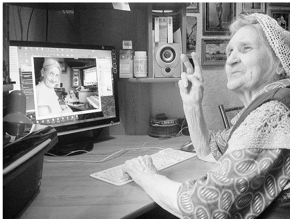
– Внуков женили, теперь свою личную жизнь будем устраивать!

Катались минут 15. Нигде не меняют. Еле нашел, чтоб разбили по 1 тысяче. Сотки у меня есть. Отдаю 4900, на что дама заявляет, что ей не нужны чужие деньги и она хочет сдачу 4895, а не 4900. Слово за слово – дама