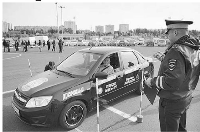
Отдел пропаганды УГИБДД МВД РТ

водители республики. В городах и районах Татарстана с тех пор проводятся предварительные этапы, в ходе которых определяются участники финала, традиционно проходящего в Казани на площадке Управления республиканской Госавтоинспекции.