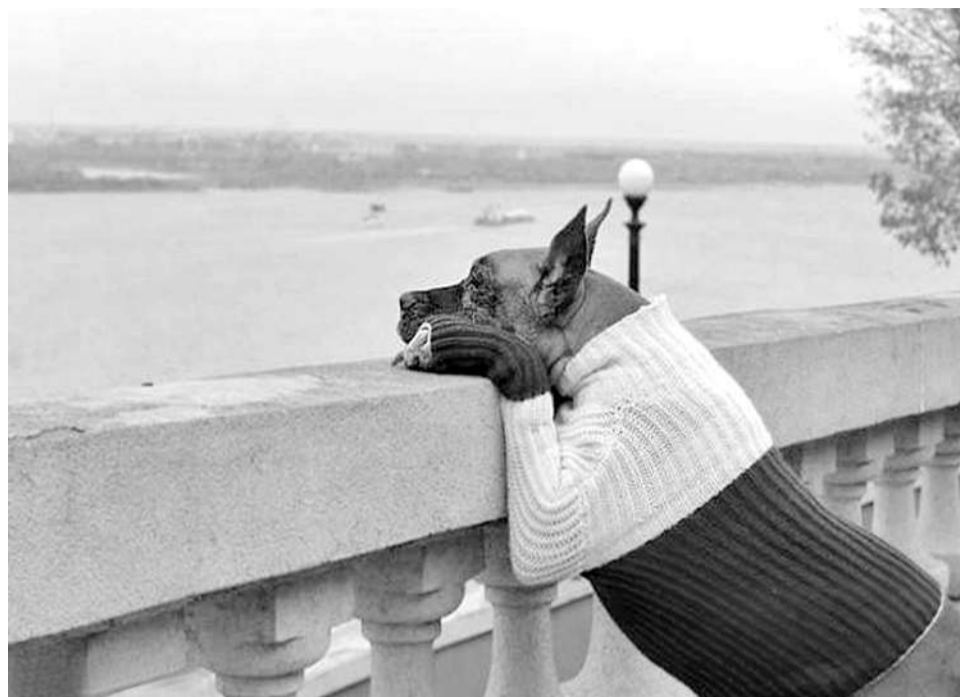
– Наступила осень, падают листья, мне никто не нужен, кроме ты...

Подруга рассказала. Пришла к ним в организацию устраиваться на работу по протекции девушка после института. Написала заявление (привожу дословно, вернее до буквенно): «Прошу пренять меня на работу иканамистом». На заявлении директор написал следующее: «Отказать! Иканамисты штатом не предусмотрены».