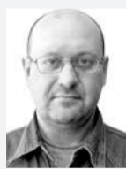
Павел ВОСКРЕСЕНСКИЙ, «РТ»

Радикализм новой власти в Ереване всерьез обеспокоил Москву