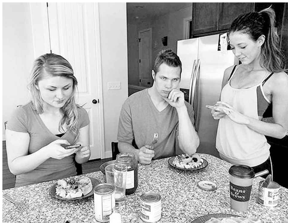
Когда сам дал жене денег на курсы «Как правильно фотографировать еду в «Инстаграм»...