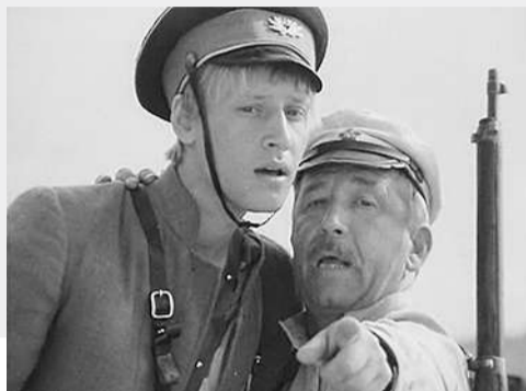
Шевченко vs Холли Холм (16+).

1920-е годы. Бывший форвард гимназической футбольной команды становится начальником одесского уездного отделения милиции. Начинается борьба с «контрреволюционными элементами».