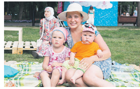
Этот праздник уже стал традиционным.

Праздник организован по инициативе Татарстанского отделения Пенсионного фонда России.