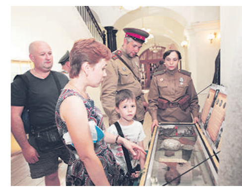
Новая экспозиция музея посвящена в том числе и популяризации поискового движения.