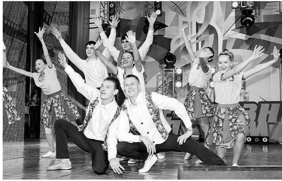
Фестиваль «Наше время – Безнен заман» всегда проходит ярко, красочно, эффектно.

Напомним: уже шестой год при поддержке Президента РТ проводится фестиваль творчества работающих молодежи, занятой на предприятиях и организациях республики. Молодые люди соревнуются в пении, хореографии, игре на музыкальных инструментах и других видах искусства.