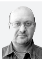
Павел ВОСКРЕСЕНСКИЙ, «РТ»

После уверенной победы на выборах президент Реджеп Эрдоган намерен в ближайшую пятилетку резко ускорить развитие страны