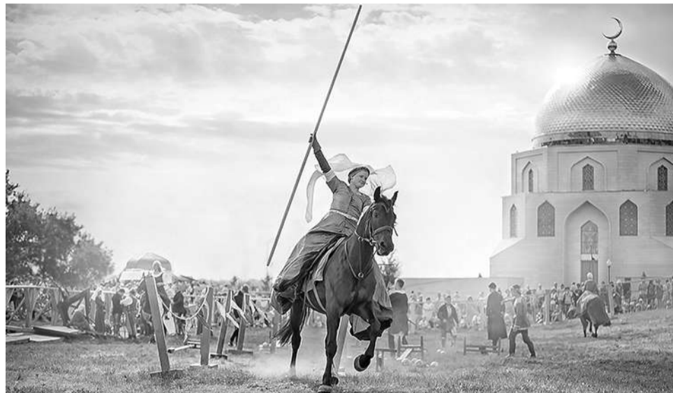
На Международном фестивале средневекового боя «Великий Болгар».