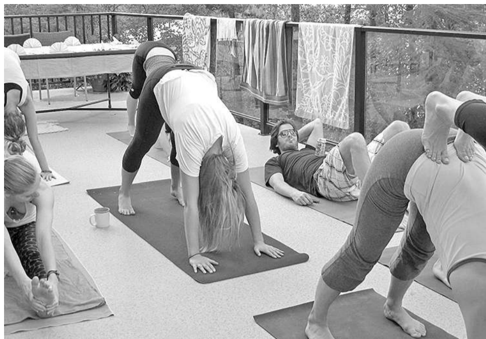
– Кто что тренирует, а я – силу воли.

Действительно, у самого звонившего за плотно зашторенными окнами именно под такими лампочками – плантация.