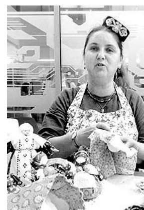
Наши предки верили, что детская кукла может исцелять.

А вот перед нами кукла-перевышив: с одной стороны — кукла-мама, с другой — дочка или бабушка, у каждой — свой головной убор, платье и передник. Цвета здесь соответствуют возрасту: для бабушки — более блестящие и степенные