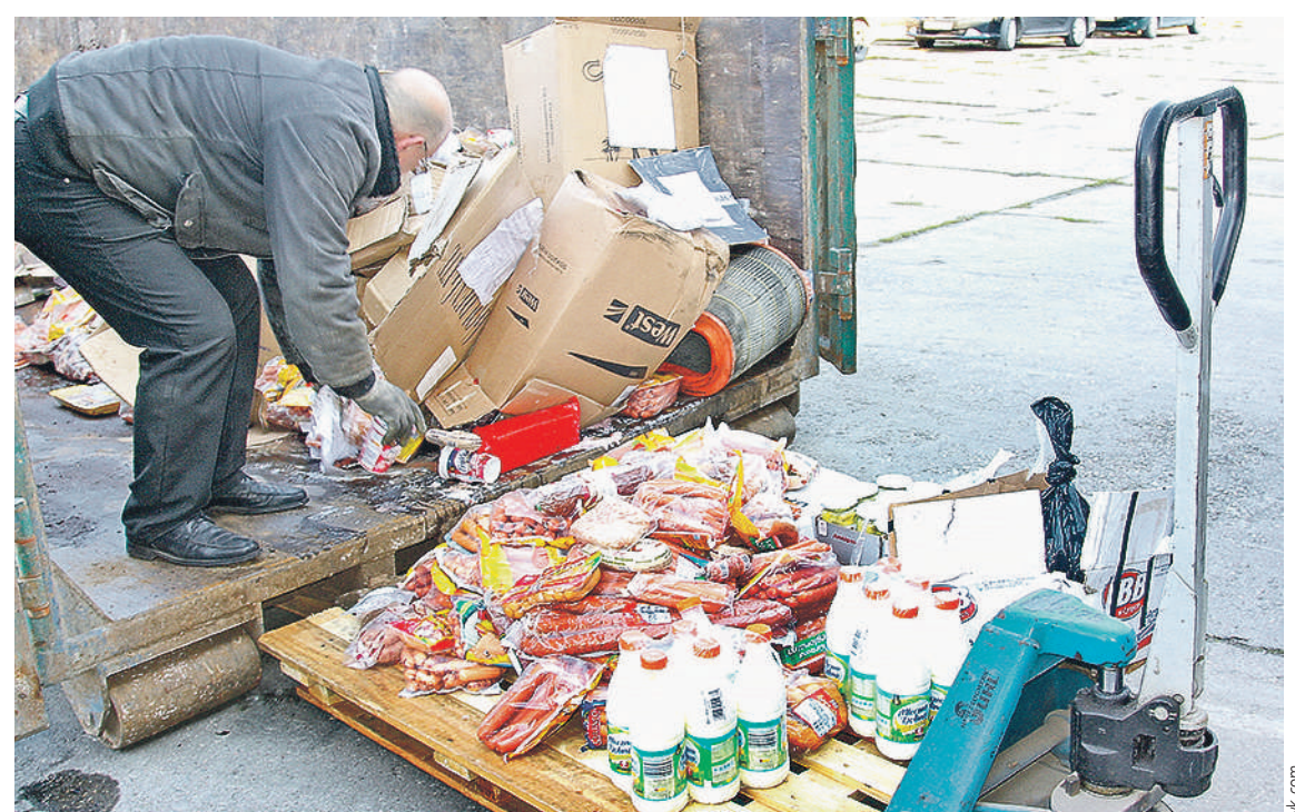
Официальная утилизация отходов требует больших расходов.