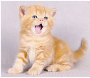
Дочке подарили почти такого же котенка.