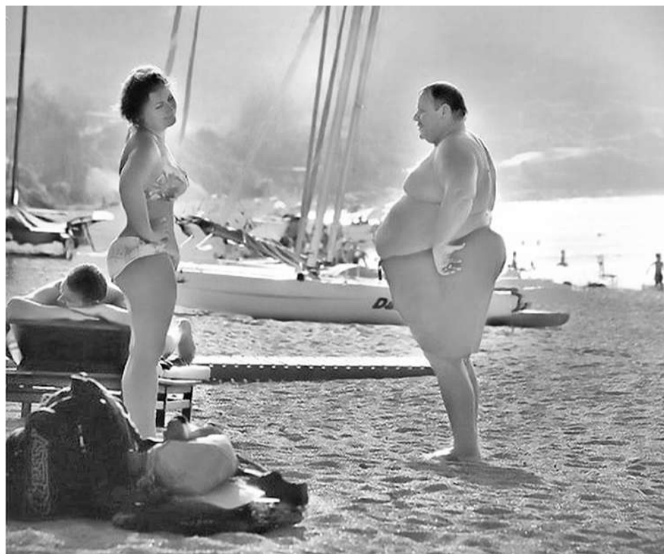
Лето покажет, кто ел по ночам.