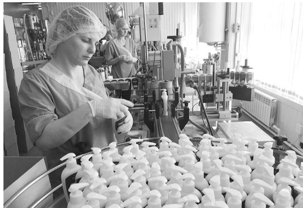
В ассортименте косметической компании «Две линии» более 150 наименований продукции из целебных алтайских трав.

В процессе экскурсии по одному из предприятий, входящих в состав научно-производственного комплекса нау-