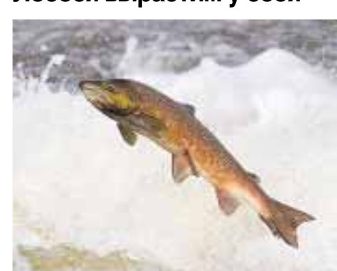
Проект аквакультурного кластера обещают запустить в ближайшее время.