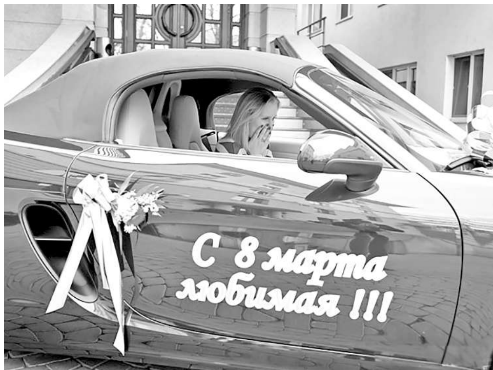
Тот случай, когда даже неграмотность благоверного не раздражает.