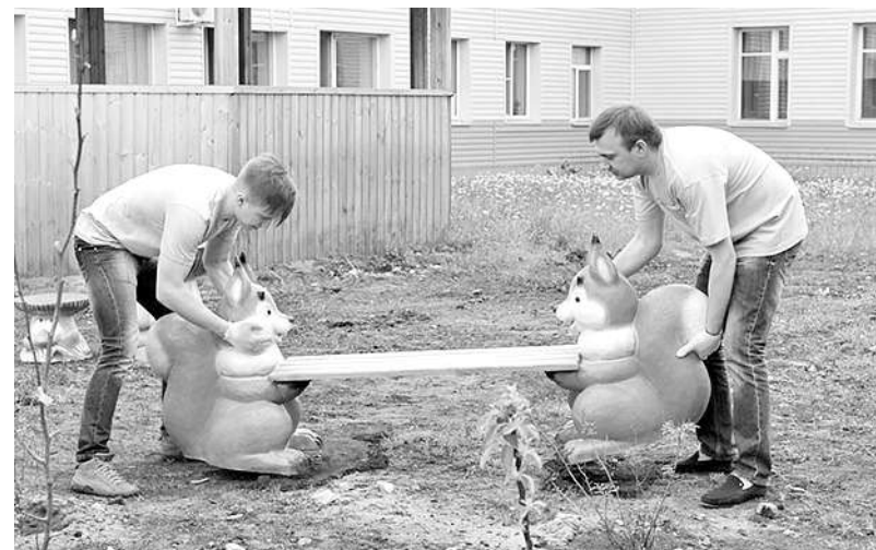
Волонтеры при поддержке РИТЭКа благоустраивают территорию Дербышкинского дома-интерната.

ряду с традиционными формами благотворительности, «ЛУКОЙЛ» много лет проводит Конкурс социальных и культурных проектов, в основу которого положены принципы состязательности и открытости – как при распределении научных грантов (в Татарстане организацией и проведением конкурса социальных и культурных проектов занимается РИТЭК, который с 1995 года успешно ведет производственную деятельность в Республике). Представить проект экспертной комиссии может любая общественная, некоммерческая организация – и при соблюдении определенных условий получить финансирование на решение той или иной социальной проблемы. При условии готовности разработчика вложить в проект чуть менее трети своих средств.