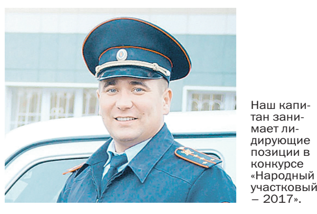
Наш капитан занимает лидирующие позиции в конкурсе «Народный участковый – 2017».