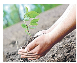
Вероника АКИФЕВА, «РТ»

На этой неделе в Татарстане проходит масштабное событие – XVII Международная конференция молодых ученых «Леса Евразии – леса Поволжья».