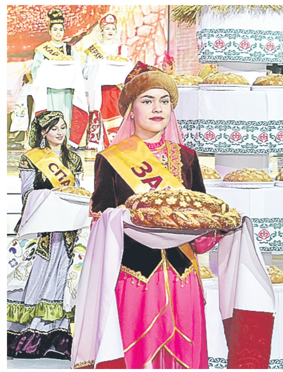
Фарида ЯКУШЕВА, «РТ»

Вчерашний торжественный прием в Казани по случаю Дня работника сельского хозяйства и перерабатывающей промышленности прошел на особенном подъеме. Ведь нынче татарстанские хлеборобы собрали более пяти миллионов тонн хлеба. Ожидается и рекордный за всю историю Татарстана урожай сахарной свеклы – около трех миллионов тонн.