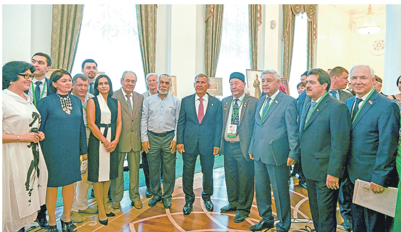
Руководители Татарстана с группой делегатов съезда перед началом форума.

Ежегодно при поддержке республики проходит целый ряд крупных мероприятий. Среди них – Всероссийский съезд предпринимателей татарских сел, Всемирный форум татарских женщин, форум «Деловые партнеры Та-