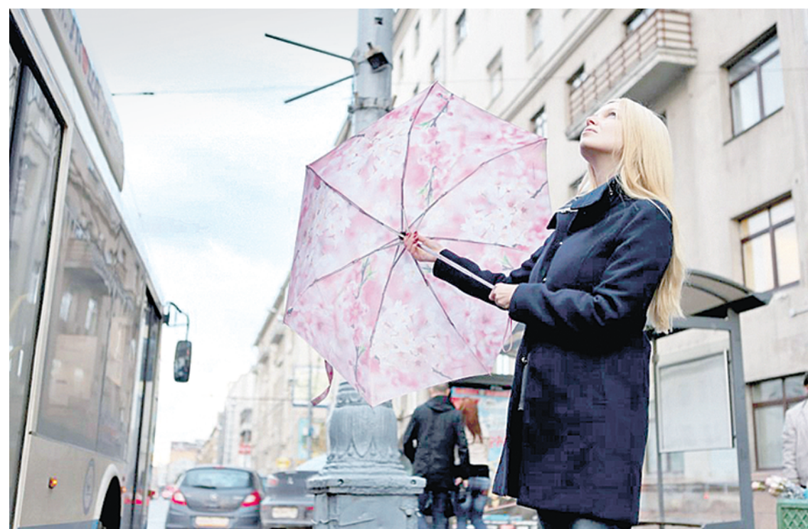
По прогнозу Росгидромета, до 16 июня температура воздуха в наших широтах будет ниже нормы.