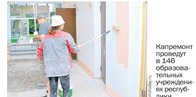
Капремонт проведут в 146 образовательных учреждениях республики.