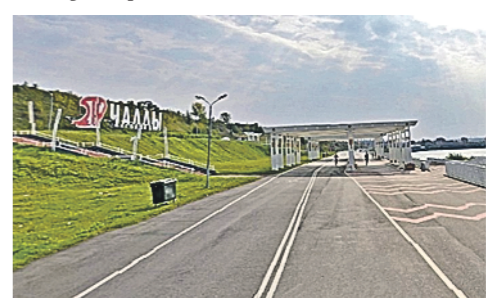
В Набережных Челнах именем Фикрята Табеева названа набережная (на снимке), а в Нижнекамске — улица.